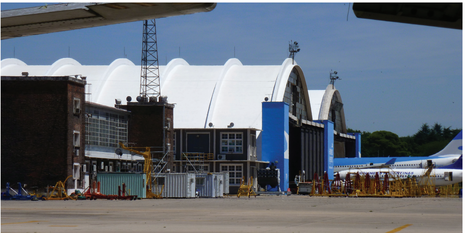
IMPERMEABILIZACIÓN DE TECHOS EN HANGARES 3 Y 4, EZEIZA. AEROLÍNEAS ARGENTINAS, CON MEMBRANA LÍQUIDA CON POLIURETANO SIKALASTIC®-560

Es la medida de la capacidad que tiene una superficie, de reflejar la luz solar, incluyendo las longitudes de onda visibles, infrarrojas y ultravioletas.