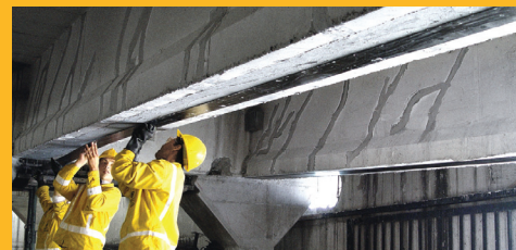
REPARACIONES Y REFUERZOS