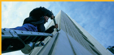
PEGADO Y SELLADO ELÁSTICO