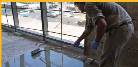
SISTEMAS DE PISOS