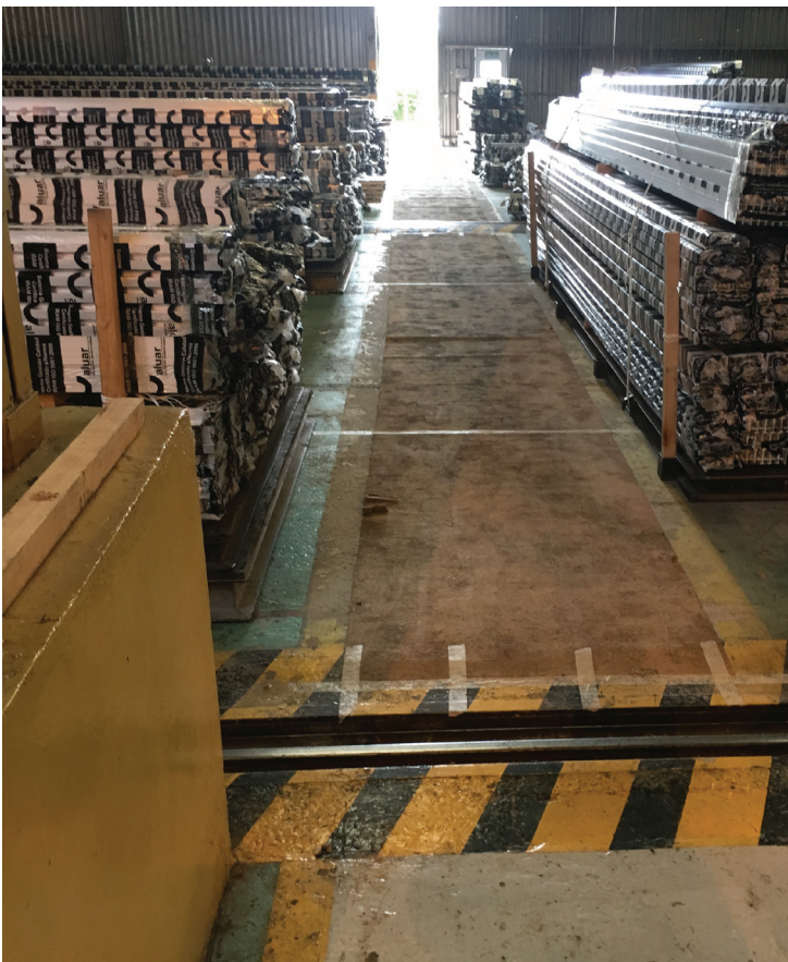
■ Estado antes de la renovación.

Por lo tanto es necesario realizar una distinción entre estos procesos. Es por ello que resulta de gran necesidad mantener claramente separados los diferentes sectores, para mantener la funcionalidad operativa y posibilitar la organización de las tareas. Esto se logra con claras demarcaciones, tal como son las sendas peatonales.